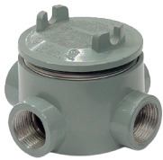
Cajas para áreas peligrosas