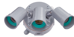
Luminaria reflectora para exteriores