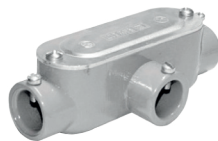
Caja de registro Oval EMT