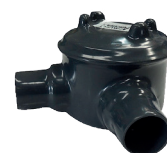
Cajas para áreas peligrosas libre de cobre