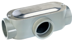
Caja de registro Oval IMC