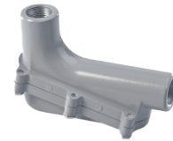
Cajas de jalado a 90° a prueba de explosión.