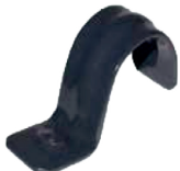
Abrazadera de "Uña"