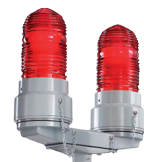
Luminaria Luz de Obstrucción