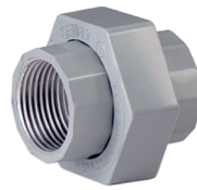
Tuerca unión de aluminio