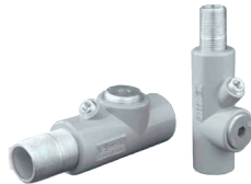
Sellos para áreas peligrosas