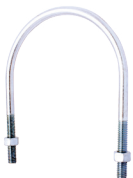
Abrazadera en "U"