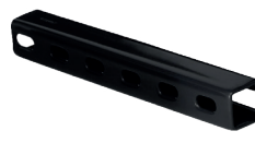
Canal Unistrut de acero galvanizado