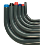
Codo Conduit rígido de aluminio