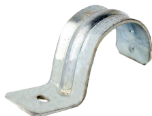
Abrazadera de "Uña"